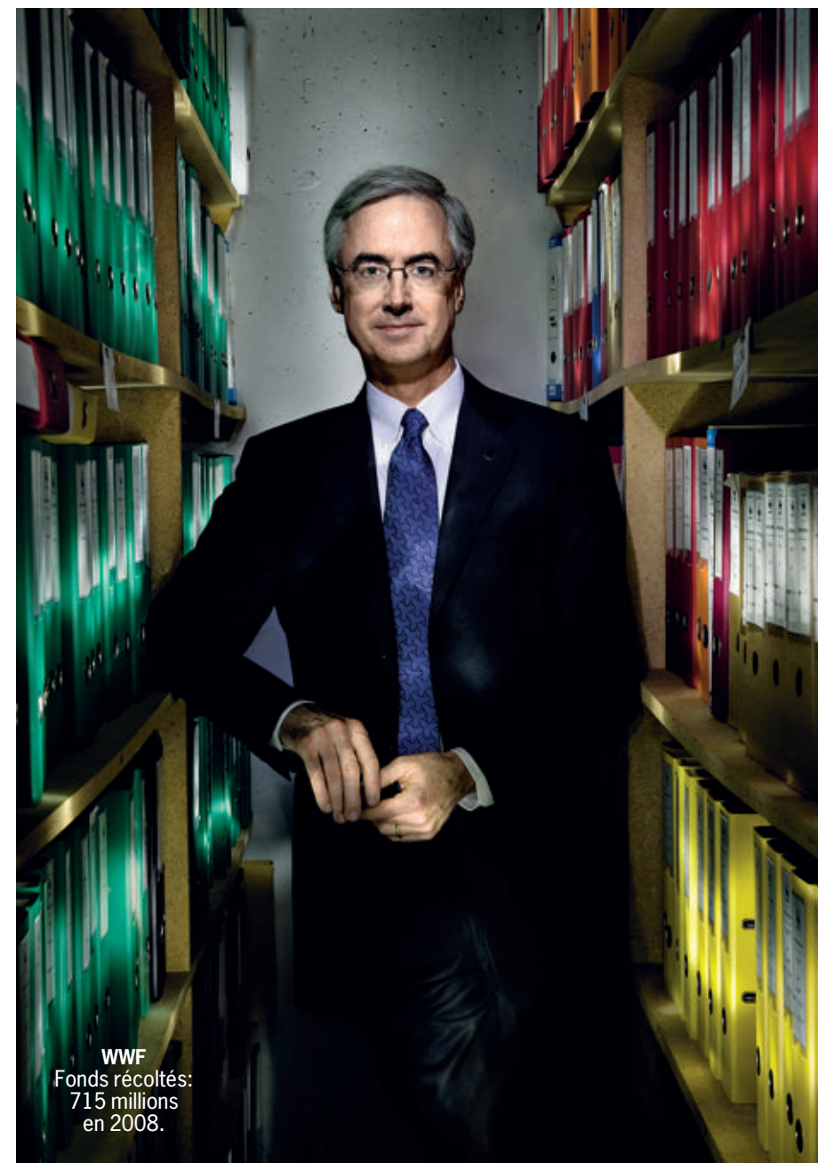
WWF Fonds récoltés: 715 millions en 2008.