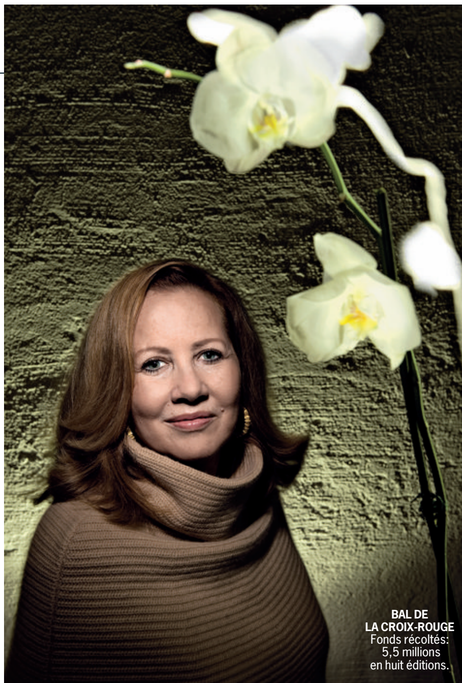
BAL DE LA CROIX-ROUGE Fonds récoltés: 5,5 millions en huit éditions.

Le président et fondateur du groupe pharmaceutique Debiopharm a créé avec la Japanese Cancer Association (JCA) un prix pour des travaux de recherche fondamentale et lancé le «Debiopharm Life Sciences Award» pour récompenser un jeune scientifique européen. L'entreprise vaudoise Debiopharm a signé un accord avec l'EPFL portant sur la somme de 2,5 millions de francs, augmentée par l'école, pour créer une chaire d'oncologie dans la Faculté des sciences de la vie.