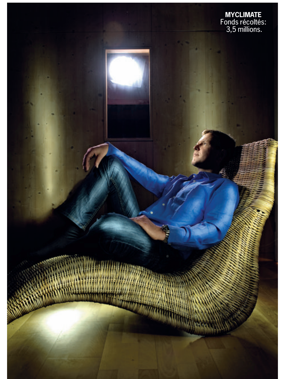
MYCLIMATE Fonds récoltés: 3,5 millions.