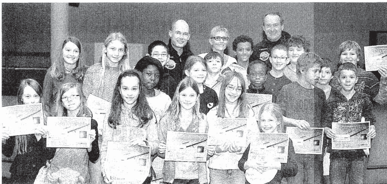
Auch mit der Affoltemer «Kleber»-Klasse posieren die Piloten.

Themen-Nr.: 520.1 Abo-Nr.: 1079516 Seite: 9 Fläche: 37'749 mm 2