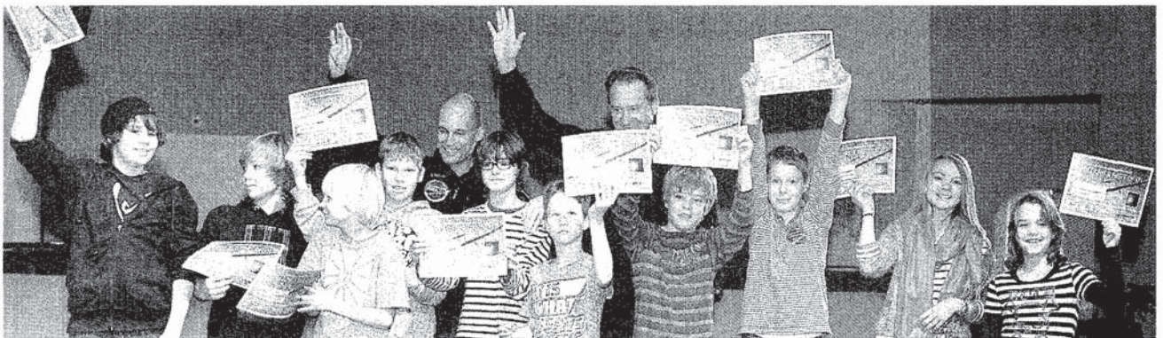
Vertreter der Bonstetter Mittelstufe mit den Solar-Pionieren Bertrand Piccard und André Borschberg.