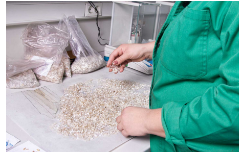
Überprüfung im Labor.

Tudor Mihail Aurel, Angestellter bei GreenTech seit 2005