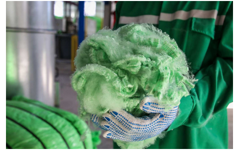
Polyesterfasern aus recycelten PET-Flaschen werden unter anderem für die Herstellung von Textilien verwendet.

Plastikrecycling in Bužău nordöstlich von Bukarest auszubauen. Aus dem einstigen kleinen Werk mit einer Kapazität von 12'000 Tonnen Plastikrecycling pro Jahr ist mittlerweile eine moderne Unternehmensgruppe geworden, die mit einer Kapazität von 100'000 Tonnen pro Jahr recycelte PET-Flocken, PET-Bänder und PET-Granulate herstellt. Diese werden in der Automobil- und Baubranche oder auch für die Herstellung von Hygieneprodukten und Filtern eingesetzt. 2022 fusionierte GreenTech mit seinem Schwesterunternehmen GreenFiber und verarbeitet nun auch PET-Flakes zu recycelten Polyesterfasern. Mit Hunderten von Arbeitsplätzen sind die zwei Unternehmen nun der grösste Arbeitgeber in Buzău, einer eher unterentwickelten Region. Die Arbeitslosenquote ist hier doppelt so hoch wie der nationale Durchschnitt.