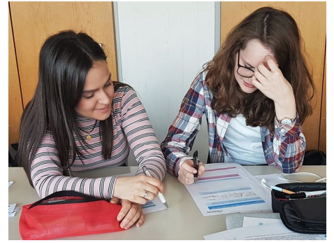
Was können wir tun? Workshop über nachhaltige Möglichkeiten beim Reisen.