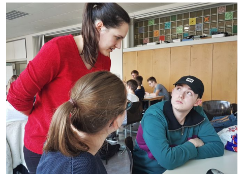
myclimate in der Schulklasse - Diskussion über «sinnvolles Reisen»