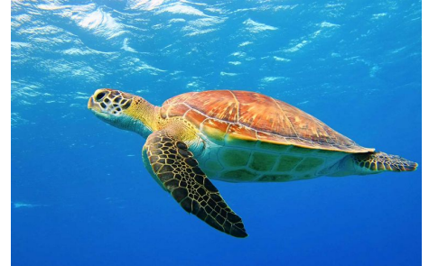
Grüne Meeresschildkröte: als gefährdet klassifiziert.