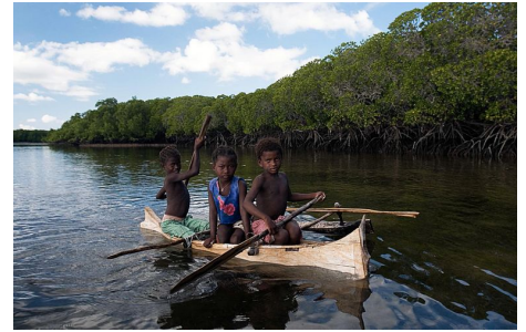
Die Mangrovenwälder in der Assasins-Bucht bieten 3'000 Menschen eine Heimat.