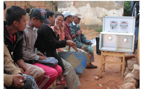
Eine Kampagne stellt sicher, dass die Bevölkerung die Vorteile effizienter Leuchten sowie deren Handhabung und Entsorgung kennt.