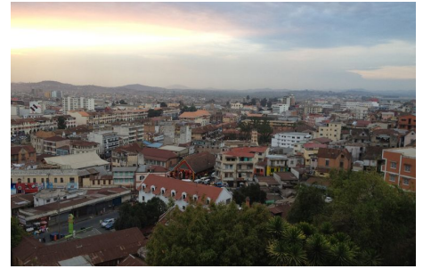
Die Mehrheit der Haushalte in Antananarivo verwendet konventionelle, ineffiziente Glühlampen. Ohne die Subvention wären hochwertige Energiesparlampen nicht verfügbar oder nicht erschwinglich.