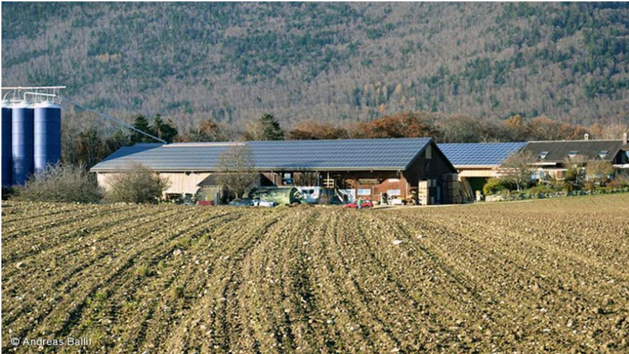
Das Klimaschutzprogramm fördert den Bau von Kleinbiogasanlagen wie zum Beispiel auf diesem Hof des Bio-Landwirts Andreas Ballif im Berner Jura.

Das Coop-Klimaschutzprogramm unterstützt landwirtschaftliche Biosuisse- oder Miini-Region Betriebe beim Bau und Betrieb einer Kleinbiogasanlage. Dank der Biogasanlage soll der anfallende Hofdünger wie Mist und Gülle künftig vergärt und in einem Blockheizkraftwerk Strom und Wärme gewonnen werden. So werden Methanemissionen vermieden, die sonst bei der Lagerung und Bearbeitung des Hofdüngers anfallen, und gleichzeitig wird erneuerbare Energie produziert. Interessierte können sich ab sofort für dieses Klimaschutzprogramm anmelden.