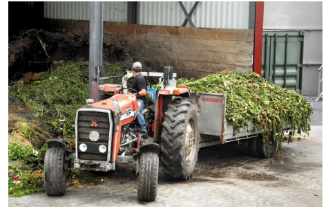
Landwirtschaftliche Biogasanlagen produzieren erneuerbare Energie und vermeiden Methanemissionen.

Für kleinere landwirtschaftliche Biogasanlagen ist die Rentabilitätsschwelle nur schwer zu erreichen. Hohe Anfangsinvestitionen, geringe Einnahmen aus dem Wärmeverkauf und der Co-Substratentsorgung sowie geringere Biogasproduktion durch Verwendung von Hofdünger führen zu Stromgestehungskosten, die über dem durch die kostendeckende Einspeisevergütung garantierten Strompreis liegen. Einnahmen aus den CO 2 -Zertifikaten, die bei diesem Projekt ausschliesslich für die Vermeidung von Methan vergeben werden, ermöglichen erst die Realisierung dieser landwirtschaftlichen Biogasanlagen und garantieren einen nachhaltigen und rentablen Betrieb. Das Projekt umfasst zwei Anlagen in den Kantonen Luzern und Aargau und wird von der Genossenschaft Ökostrom Schweiz entwickelt und durchgeführt.