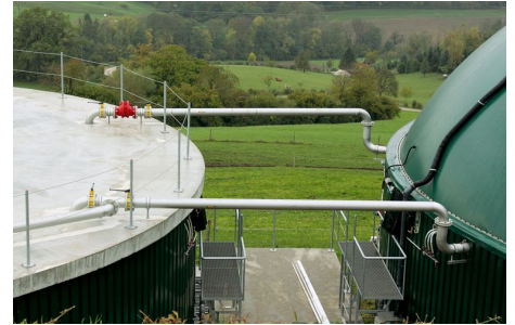
Ein Doppelmembran-Dach auf dem Gärtank und ein abgedecktes Endlager für die Gärreste garantieren, dass kein Methan entweicht.