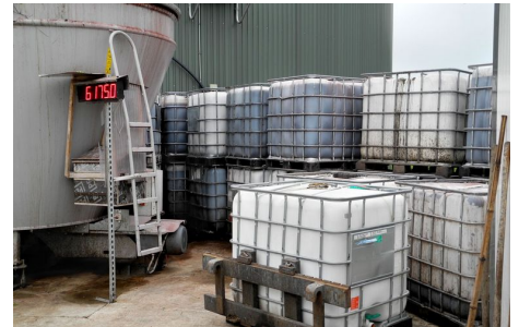
Energiereicher als Hofdünger für die Biogasproduktion sind Co-Substrate wie Glycerin, ein Nebenprodukt aus der Herstellung von Biodiesel, sowie Getreideabgang und Grüngut.