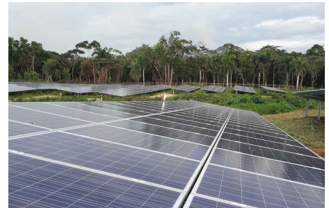
Sobald auch alle Solarpanels der Phase 2 stehen, wird das Projekt den momentanen Anteil an Photovoltaik am Energiemix der Dominikanischen Republik verfünffachen.