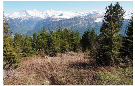
Gemmenalphorn: Blick Richtung Berner Alpen.

Der erhöhte Holzvorrat soll im Durchschnitt jährlich bis zu 3'407 Tonnen CO 2 aus der Atmosphäre entziehen. Über die gesamte Projektdauer von 50 Jahren entspricht dies einer Emissionsreduktion von bis zu 170'345 Tonnen CO 2 .