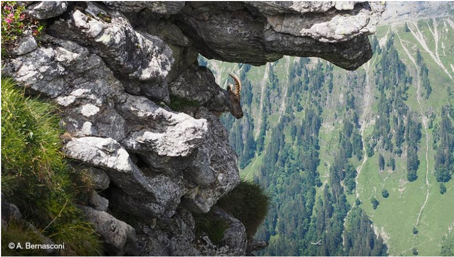
Ein Steinbock untersucht seine Umgebung.

Das Wald-Klimaschutzprojekt in der Region Beatenberg-Habkern in der Schweiz unterstützt die Umsetzung und Kontrolle eines Naturwaldreservates. Durch den vollständigen Verzicht auf die Nutzung des Holzes kann sich der Wald ungestört entfalten, der Atmosphäre mehr CO 2 entziehen sowie vielen Tier- und Pflanzenarten einen ruhigen, ungestörten Lebensraum bieten. Zudem helfen Wälder, Schadstoffe aus der Luft und im Boden zu filtern und tragen somit zu mehr sauberem Wasser bei.