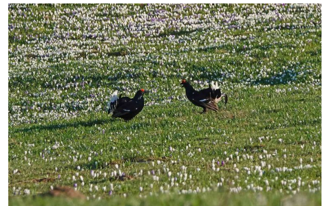
Birkhühner zählen zu den Leitarten des Naturwaldreservats.