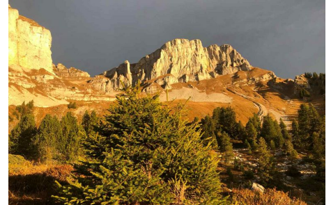
Hohgant/Furggütsch im Novemberlicht.