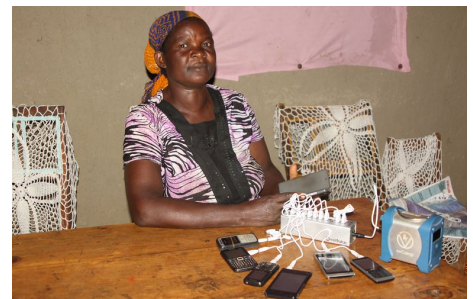
Solar Kit mit Telefonaufladestation ermöglicht ein Einkommen für Schulgeld und Essen.