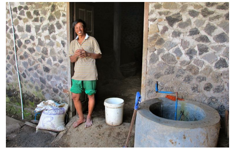
Kleinbauer Sukrano auf Java ist zufriedener Besitzer einer Klein-Biogasanlage aus diesem Programme of Activity.

Die Haushalte profitieren von höheren Erträgen dank der Ausbringung der Gülle auf die Felder.