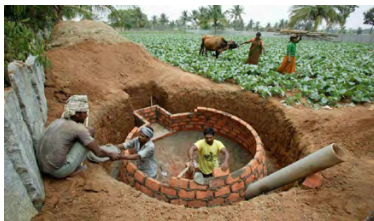
Inde: Construction de centrales de biogaz