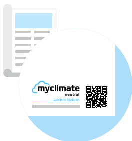
Label avec numéro de suivi