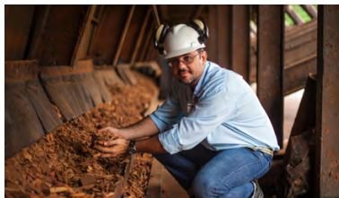
Brésil: De l'électricité issue des déchets de bois FSC en Amazonie