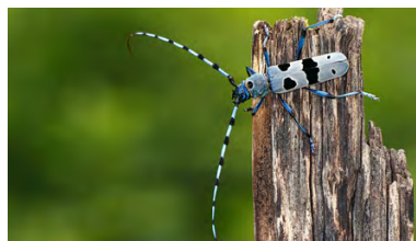
Svizzera: Protezione degli animali, della natura e del clima