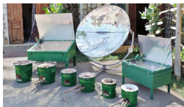
Madagascar: Fornelli solari e fornelli efficienti