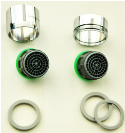
Cascade SLC AC