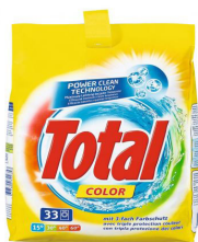
Total Color 15° C Dosage standard 75g

Les détergents couleur suivants ont été testés: