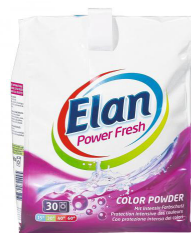
Elan Power Fresh Color 15° C Dosage standard 75g

Unité fonctionnelle: un cycle de lavage avec 4,5 kg de linge normalement sale au programme de lavage recommandé. Selon le produit, le dosage est différent : il est utilisé selon les recommandations du fabricant.t.