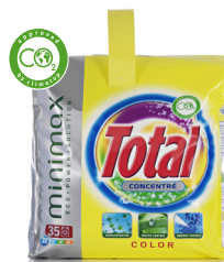
Total Minimax Color 15° C Dosage standard 50g