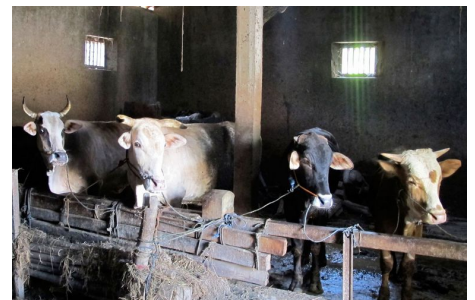
Le programme couvre différentes provinces à travers le pays. À Java, avec sa majorité musulmane, la bouse de vache est la principale source de production de biogaz.