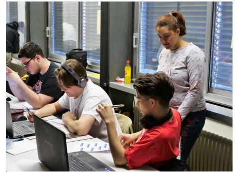
Echange entre les étudiants.